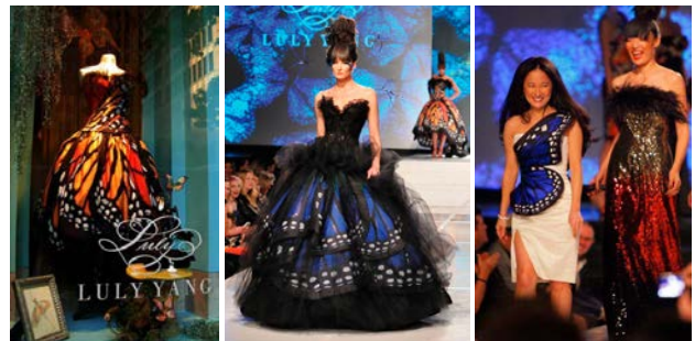
Рис. 2. Творче джерело «метелики» у колекції дизайнера Лулі Янг

Творче джерело «метелики» неодноразово надихали відомих дизайнерів для створення колекції одягу, зокрема Лулі Янг (Рис. 2.), Жан-Поль Готьє (Рис. 3.) та інших.