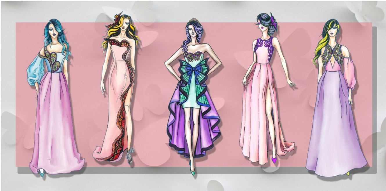
Рис. 4. Ескізи колекції урочистих суконь « Butterfly story » створені на основі творчого джерела «метелики»

абстрактно; в ескізах, створених за асоціаціями, має простежуватися зв'язок з першоджерелом [7, с. 59-60]. Розроблена в результаті дослідження авторська колекція суконь для випускного балу « Butterfly story » (рис. 4) є перспективною, на її основі можуть бути створені нові моделі із застосуванням нестандартних авторських і дизайнерських рішень.