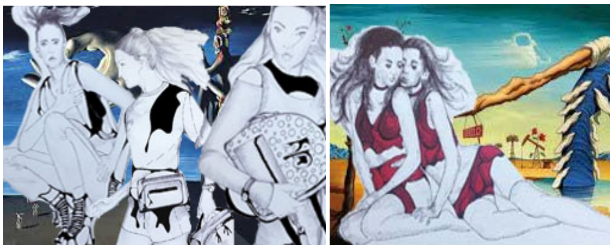
Рис. 3. Пропозиції творчо-образного ескізного рішення колекції

проектування сучасної колекції жіночого одягу (рис. 3). Колекцію моделей жіночого молодіжного одягу за мистецьким напрямком сюрреалізм виконано в матеріалі та представлено на XVI Міжнародному конкурсі «Печерські каштани».