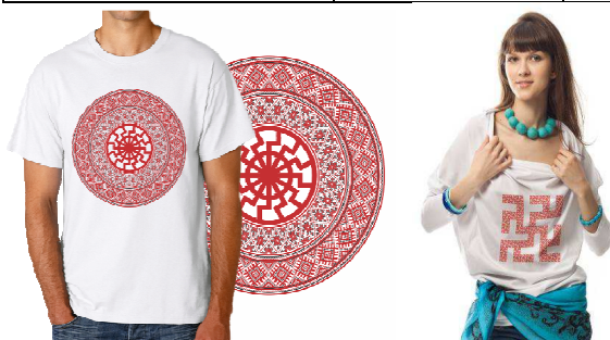
Рис. 4. Використання символів-оберегів в сучасному одязі

Отже, орнаментоване символами-оберегами дизайнерське зображення формує повідомлення, яке відповідає основним характеристикам національного менталітету, дозволяє подолати психологічні бар'єри, які стоять перед рекламним посиланням, і є важливою умовою ефективної візуальної комунікації при створенні виробів графічного дизайну. Крім того, використання давніх архетипів дозволяє залучити підсвідоме у