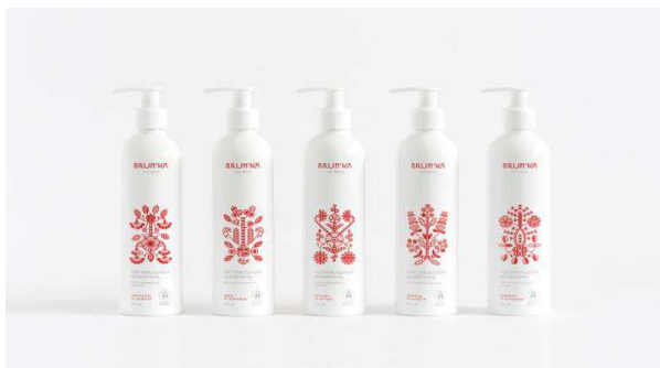
Рис.2. Використання стилізованого символу-оберегу Дерево життя (Студія графічного дизайну Юрка Гуцуляка) для пакування лінійки першої української органічної косметики Brun'ka

Життя зображується у вишивках цього символу-оберегу зростаючим з квіткового горщика. Цей елемент презентує ідею, що Дерево Роду є частиною, невеликою гілкою Світового Дерева Життя.