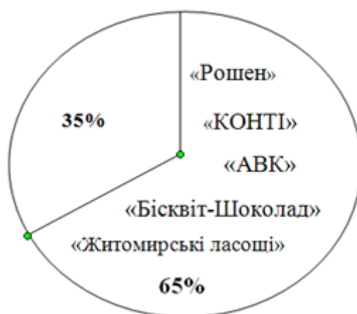
Рис. 2. Вітчизняний ринок кондитерських виробів

Крім того, ринок кондитерських виробів України є висококонцентрованим. Понад 65% його поділено між п'ятьма компаніями: Корпорація «Рошен», ПАТ «ВО «КОНТИ», ПАТ «АВК», Корпорація «Бісквіт-Шоколад» та ПАТ «Житомирські ласощі», що наведено на рис. 2. Дрібні підприємства не намагаються конкурувати з великими компаніями і намагаються займати вільні ніші в регіонах.