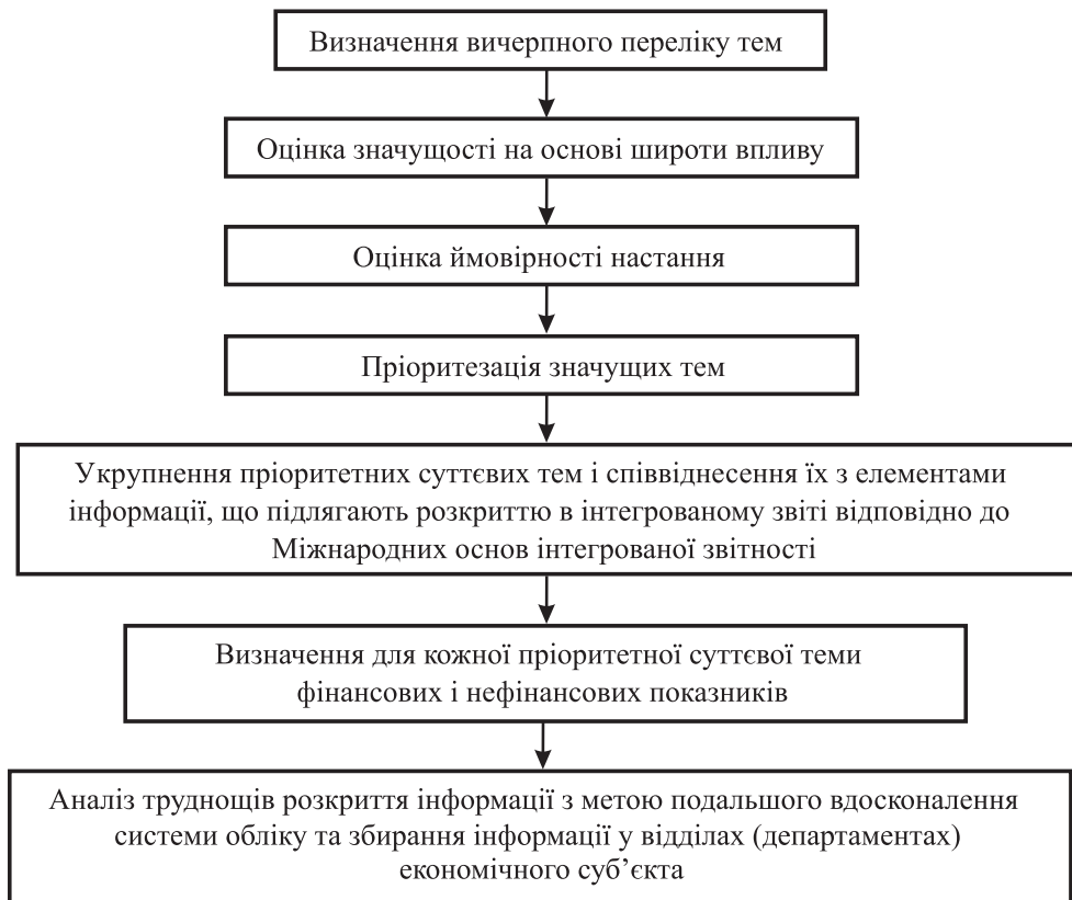
Рис. 2. Алгоритм визначення суттєвості для цілей інтегрованої звітності

Н. Малиновська наводить алгоритм визначення суттєвості для цілей інтегрованої звітності (рис. 2).