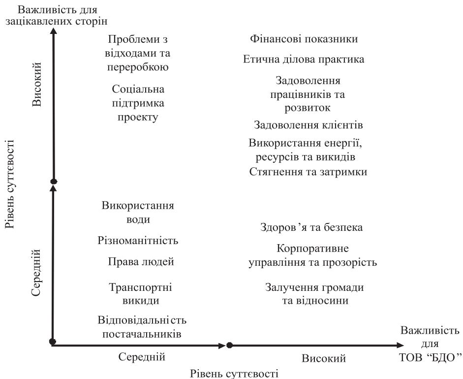
Рис. 3. Карта суттєвості в інтегрованій звітності ТОВ “БДО”