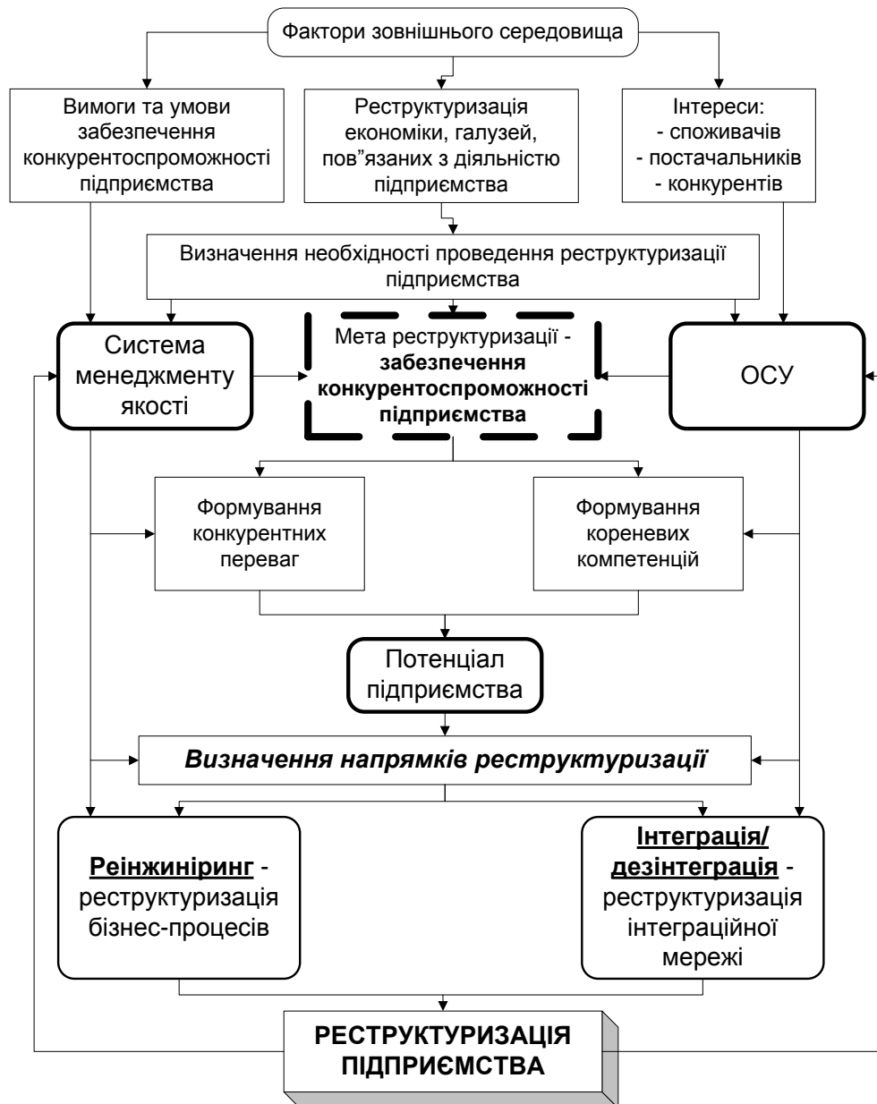
Рис. 2. Блок-схема організаційного механізму реструктуризації підприємства

До елементів даного механізму можна віднести: