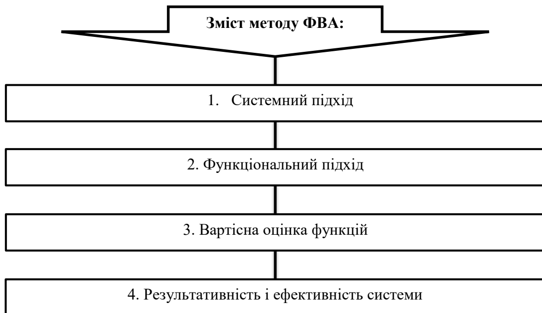
Рис. 1. Зміст методу побудови процесу створення творчих колекцій на основі функціонально-вартісного аналізу

Одним з важливих понять в дослідженні розвитку моди є поняття сезону, котре визначає період часу на протязі якого продаються відповідні модні товари. У відношенні до дизайну одягу виділяють два основних періоди: весна-літо та осінь – зима, що характеризують відповідний характер та набір моделей в перспективних колекціях. До варіацій найбільш успішних модних тенденцій перспективних моделей можуть входити характерні деталі нового стилю, додаткові нюанси кольору, оздоблення та доповнень.