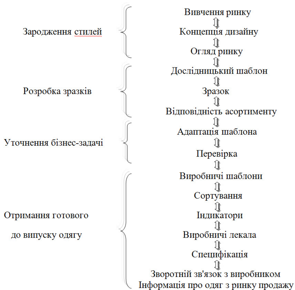
Рис. 1. Процес дизайну одягу в розробці товарної продукції

Модні бренди стають доступними більшості звичайних людей, що надає поштовх до зростання попиту на підвищення якості, що досягається з використанням принципів креативного. (рис.2).