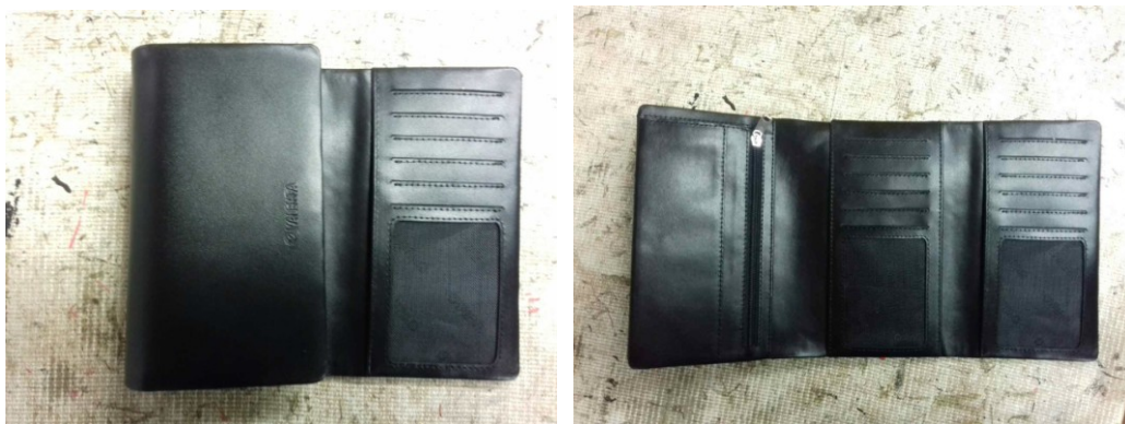
Рис. 1. Досліджуваний виріб (портмоне складної конструкції)

Для проведення досліджень по визначенню технологічних параметрів ниткових з'єднань при виробництві шкіргалантерейних виробів згідно методики описаних в ДСТУ-18321 «Методи випробування ниткових швів» (чинний з 01.08.2005 р.) було обрано виріб – портмоне складної конструкції, оскільки виріб хоча і належить до дрібної галантереї, але є трудомістким, а значить і затратним [2, 3].