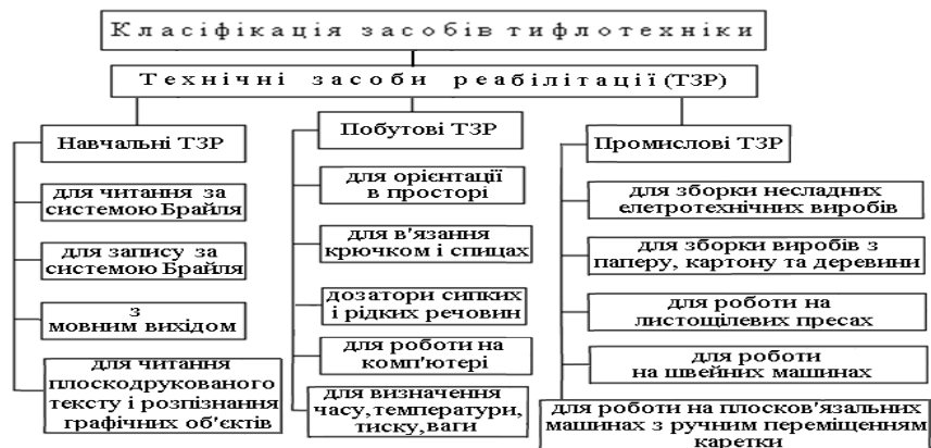
Рис.1. Узагальнена схема класифікації засобів тифлотехніки

Різні відчуття, сприймані нервовими закінченнями шкіри кінцівок пальців рук передаються в кору головного мозку у відділ, пов'язаний з роботою рук і кінчиків пальців. Так незряча людина і людина із залишками зору вчать «бачити» кінчиками пальців руки швейну машину і зрізи деталей з текстильного матеріалу, якими потрібно керувати вручну відносно голки і притискної лапки швейної машини. Також разом з дотиком у сліпих людей при роботі на швейної або плоско в'язальної машинах важливу роль грає слухове сприйняття віброакустичних і шумових характеристик машин і звукових сигналів при обриві ниток та необхідності зміщення вправо/вліво положення зрізу матеріалів відносно голки і притискної лапки. Інформаційними маркерами обриву голкової нитки/ниток і положенні зрізу матеріалів відносно голки і притискної лапки є, наприклад, програмування надходження у навушники різних за тональністю звукових сигналів від фотодатчиків.