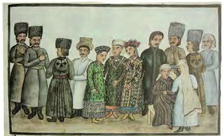
Lesons des villages Verprik, Plesetske, Vylshanka, Baraxti, du bouay de Kostow, Vihit de Yassikov, arrondissement de Kiev. Krestiane selenixъ Verprikovskogo, Plesetskogo, Vylshanskogo, Olshanskogo, Baraxtynskogo, i.ч. Фастова, Васильківського повіту, Київської губернії.

Спадщина Де ля Фліза може надихнути на творчі ідеї багатьох дизайнерів. Це дуже цікавий матеріал з історії українського костюма, адже малюнки Де ля Фліза, зняті з натури, дають можливість уявити різноманітність видів та форм українського народного одягу Наддніпрянщини і Полісся (сорочки, свити, кожухи, юпки, головні убори, взуття, прикраси), пропорційне співвідношення елементів одягу, крій, колорит, оздоблення, способи носіння. На рис.1-4 представлені фотографії замальовок дослідника Домініка Де ля Фліза, зроблені Інститутом української археографії та джерелознавства ім. М.С.Грушевського НАН України [3] та фотографії автора, зроблені із оригіналів малюнків Де ля Фліза, які зберігаються в Чернігівському історичному музеї ім.В.В.Тарновського.