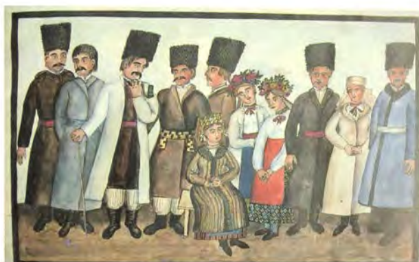
Les habitants des villages: Ulitanka, Kuzonkova, Vouzavka, Luitovka, Ahinov, Tripoli, Vitatshew, Soukowsko, et Bilogorodka, district de Kiev. Крестіане селянські Улітанького, Кожухівського, Бугаївського, Дмитрівського, Димерського, Трипільського, Вітачівського, Жуківського та Білогородського Київського повіту.