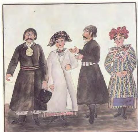
Мешканці Фастівського товариства