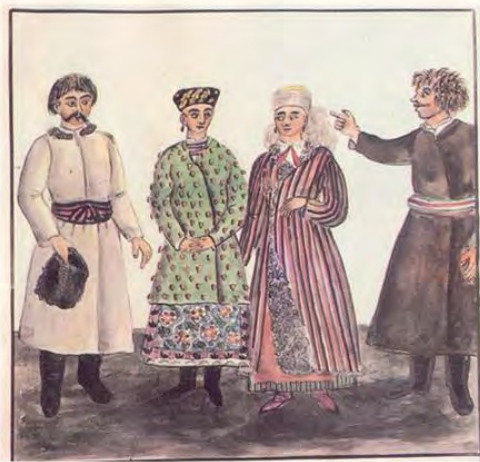
Мешканці Обухівського товариства