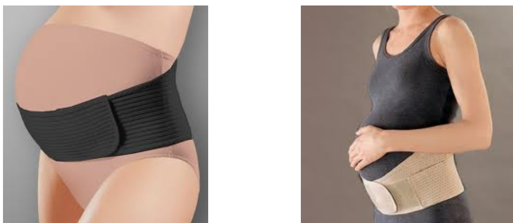
Рис. 2. Конструкції сучасних дородових бандажів [5]

Більшість сучасних трикотажних еластомірних дородових бандажів виготовляється кількох конструкцій. Перша – у вигляді поперечного поясу, який складається з комбінації еластомірних стрічок різної ширини (рис. 2).