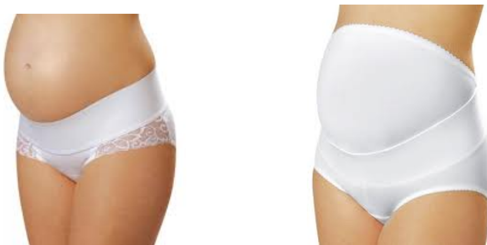
Рис. 3. Конструкції бандажів у вигляді корсетів-трусів [5]

Друга – у вигляді еластомірних корсетів-трусів (рис.3).