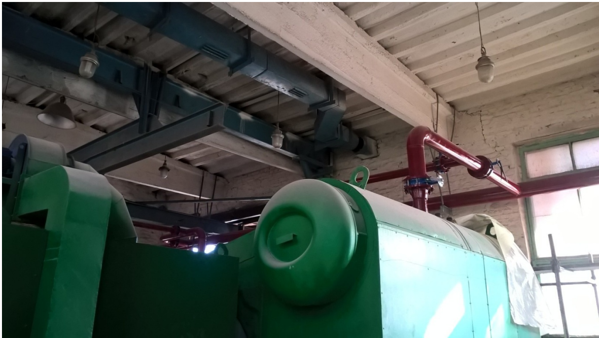
Рис. 4 Змонтований твердопаливний котел з обв'язкою трубопроводами в будівлі котельні НУВГП