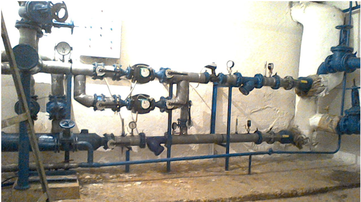
Рис. 3 Автоматизований вузол регулювання теплової енергії навчального корпусу №6

Питання енергоефективності займають одне з перших місць і в діяльності науково-дослідного виробничого бізнес-центру (НДВБЦ) НУВГП в таких аспектах як: