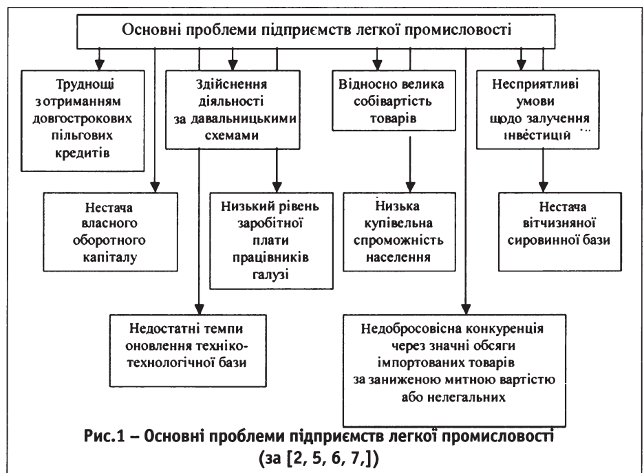
Рис.1 – Основні проблеми підприємств легкої промисловості (за [2, 5, 6, 7.]

Зазначимо, що вартість кінцевої продукції підприємств легкої промисловості значною мірою визначається сировинною наповненістю виробничого процесу. Рівень собівартості продукції має тенденцію до зростання, що зумовлено, передусім, підвищенням цін на сировину та матеріали, а також енергоносії, збільшенням частки амортизаційних відрахувань через технічне оновлення виробництва.