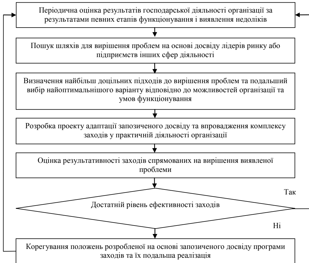
Рис. 2. Алгоритм прийняття управлінського рішення на основі застосування бенчмаркінгу

Ефективне застосування бенчмаркінгу передбачає заздалегідь спрямований процес та визначення пріоритетних напрямків дослідження, зосередившись на досягненні конкретної мети. Технологія бенчмаркінгу сприяє удосконаленню процесу прийняття управлінських рішень.