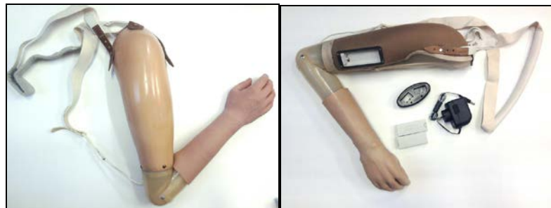
Рис.1. Протези верхніх кінцівок

В роботі досліджено структуру основов'язаної еластичної стрічки, яка застосовується при виготовленні засобів реабілітації - протезних виробів. Адже кріплення протезів досить часто буває за допомогою текстильної еластичної стрічки (рис.1).