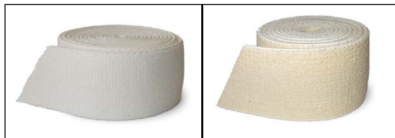
Рис. 2. Подвійний еластичний основов'язаний трикотаж (протезна стрічка)

Результати та їх обговорення. В даній роботі розглянуто подвійний еластичний основов'язаний трикотаж у вигляді стрічки, який застосовується при виготовленні протезних виробів для людей, що мають обмеження в русі (рис.2).