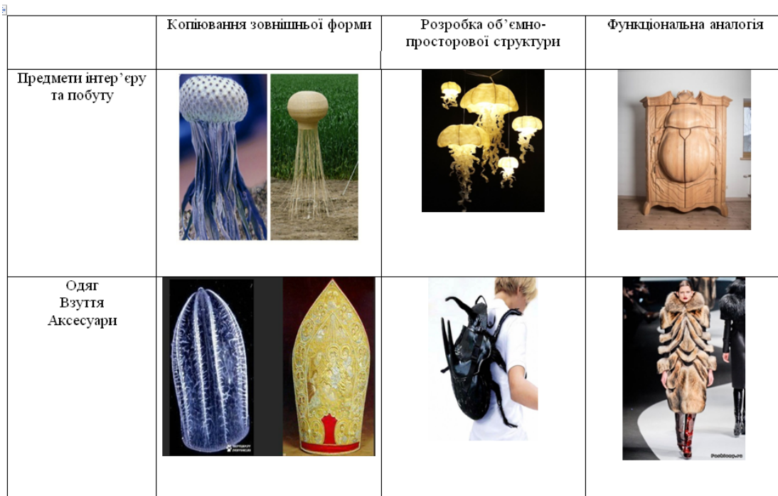
Рис. 1 Застосування біонічних принципів формоутворення в художньому проектуванні

Потрібно врахувати, що предметний світ є частиною біосфери і підпорядковується насамперед законам біонічного та суспільного розвитку (рис. 1).