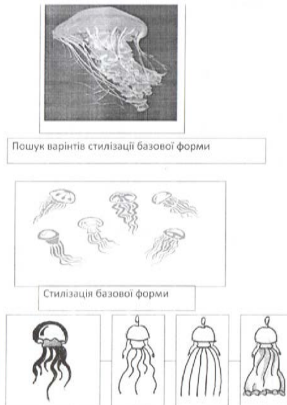
Рис.2. Проведення біоаналізу від проформи до базової форми

сполучення визначених силуетних форм з художньо-композиційними елементами внутрішньої об'ємно-просторової структури.