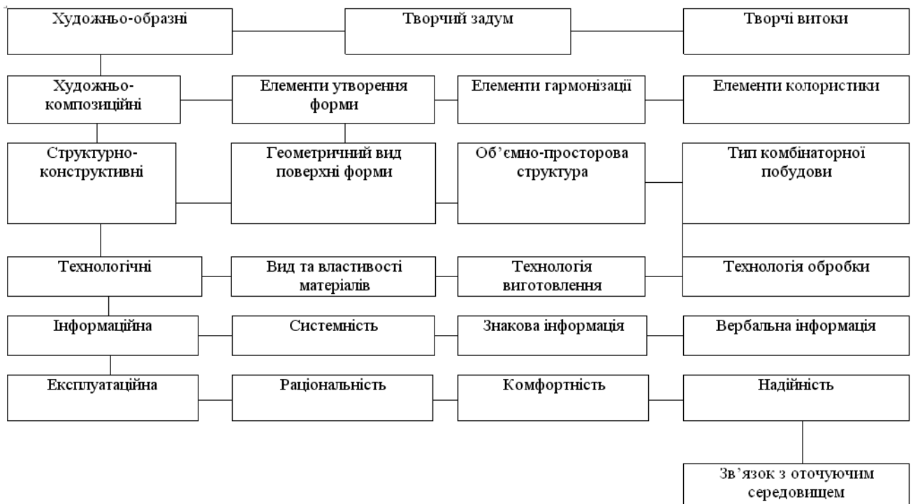
Схема 1. Розробка принципів формоутворення одягу на засадах художнього конструювання

Результати дослідження. Біоніка в художньому проєктуванні це одночасно наука і мистецтво, аналіз і синтез, пошук оригінального, нового. Вивчення форм живої природи живить фантазію художника, дає матеріал і допомагає вирішувати проблему гармонії функціонального та естетичного, збагачуючи засоби гармонізації найбільш виразними пропорціями, ритмом, динамікою. Перш ніж досліджувати природний об'єкт, необхідно знати, що саме обирати в природі. Потрібно керуватися потребами дизайну і проектними можливостями відтворення принципів побудови живих форм. Почуття проектної пластики та структури форми може допомогти відібрати необхідні та корисні функції і форми живої природи. Необхідно знати живу природу, закономірності та принципи формоутворення об'єктів у всій суперечливості їх розвитку, з урахуванням єдності організму і середовища (Схема 1).