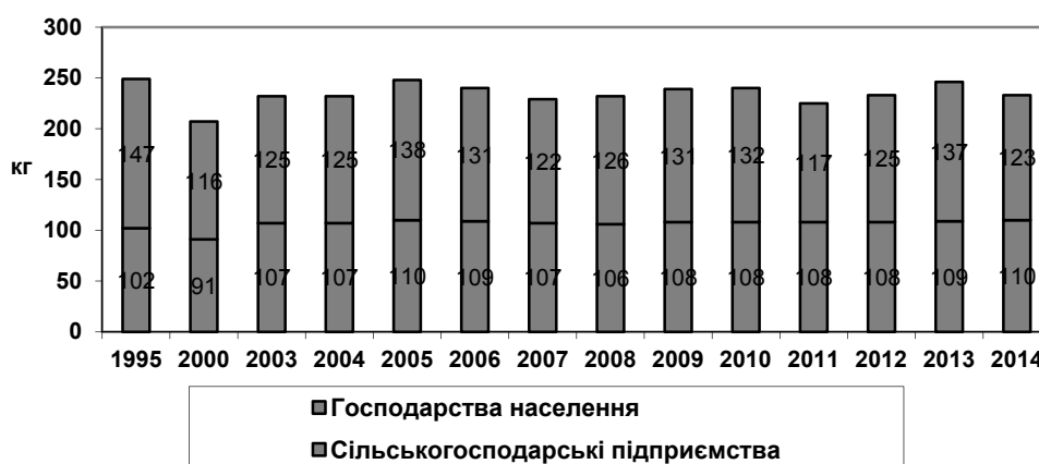
Рис. 3.4. Середня вага голови а) ВРХ, б) свині, які продані підприємствам і організаціям м'ясної промисловості за категоріями господарств 230 , кг

Середня вага голови ВРХ та свиней, що були здані до підприємств та організацій м'ясної промисловості, вирощених у особистих селянських господарствах стабільно протягом аналізованого періоду перевищувала вагу тварин, вирощених у сільськогосподарських підприємствах.