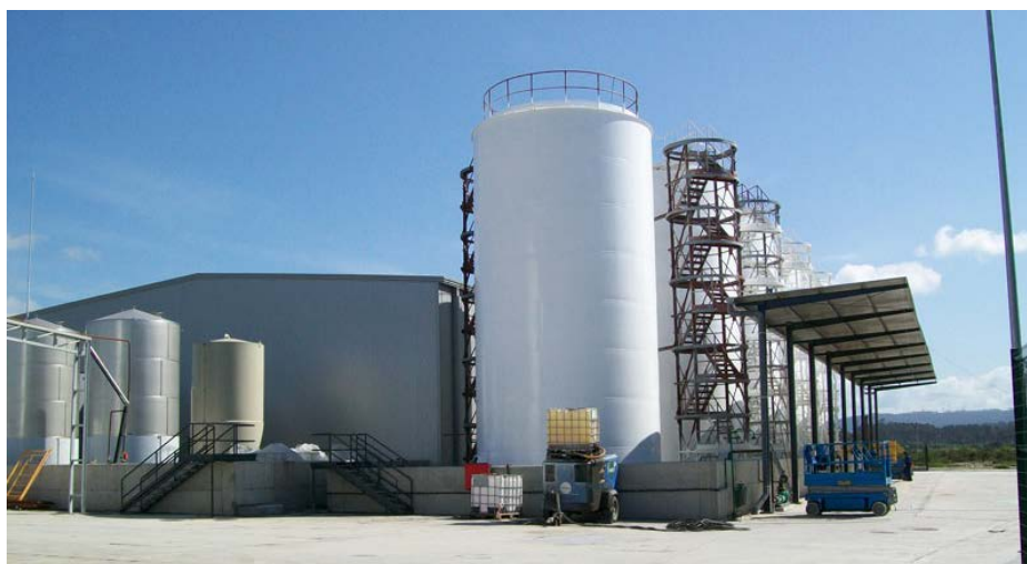
Рис. 1. Завод по виробництву біодизелю в Іспанії (Naron, Galicia), побудований компанією ТОВ «Завод Укрбудмаш»

В Україні установки будь-якої потужності як малої (від 1000 л/год) так і великої (до 16 тис. л/год) для виробництва біодизелю створює полтавський ТОВ «Завод Укрбудмаш». Нещодавно завод з виробництва біодизелю був розроблений та запущений у дію колективом ТОВ «Завод Укрбудмаш» в Іспанії (рис. 1). Такі біодизельні заводи працюють на різній сировині (будь-яка рослинна олія або тваринний жир), а енергоспоживання їх становить менше 0,02 кВт/л.