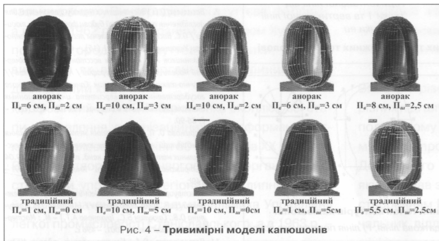
Рис. 4 – Тривимірні моделі капюшонів