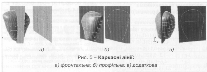
Рис. 5 – Каркасні лінії:

а) фронтальна; б) профільна; в) додаткова