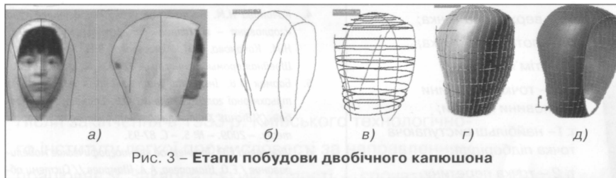
Рис. 3 – Етапи побудови двобічного капюшона