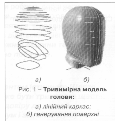
Рис. 1 – Тривимірна модель голови:

Згідно з аналізом асортименту двобічного одягу виявлено, що типовим двобічним капюшоном є відрізний (100 %), овальної форми (88 %). Капюшон складається з 2-х (55 %) або 3-х частин (45 %) і драпірується (81 %). Вид капюшона анорак зустрічається найчастіше (31 %), проте кількісне співвідношення не достатнє, аби вважати його типовим (менше 45 %), тому виникає необхідність розглядати традиційний вид капюшона (19 %).