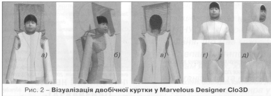
Рис. 2 – Візуалізація двобічної куртки у Marvelous Designer Clo3D

За допомогою кнопки Prt sc отримано серію фотографій (вигляд спереду, збоку, ззаду) (рис. 2), які є основою для побудови проєкцій капюшона.