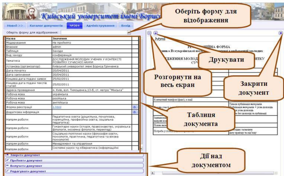
Рис. 2. Відображення документа у режимі «Перегляд документів»

– Режим перегляду документів. У даному режимі надається можливість переглянути вміст попередньо вибраного або створеного документу. При необхідності можна переглянути документ у вигляді форми, завантажити і переглянути вміст файлів, перейти в режим редагування для внесення необхідних змін та ін. (Рис. 2).