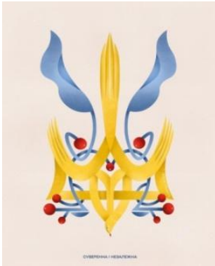
Рисунок 5. Плакат «Суверенна і незалежна» (Лишанець Ю., 2023)