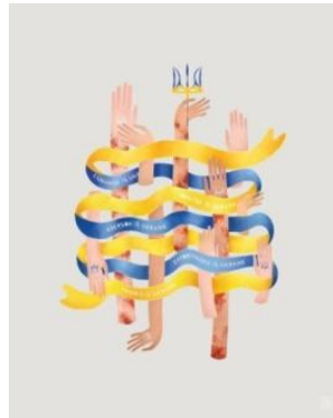
Рисунок 6. Плакат «This is our land» (Лишанець Ю., 2022)

Дослідження підтверджують, що плакати слугують потужним засобом емоційного впливу, формуючи не лише соціальну, а й екологічну свідомість, тим самим підкреслюючи їхню універсальність та суспільний вплив.