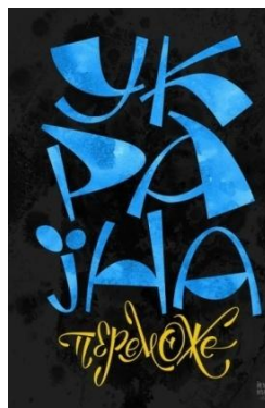
Рисунок 3. Плакат «Україна переможе» (Харук Є., 2022)