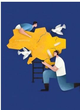
Рисунок 2. Плакат «Суверенна» (Пишанець Ю., 2022)