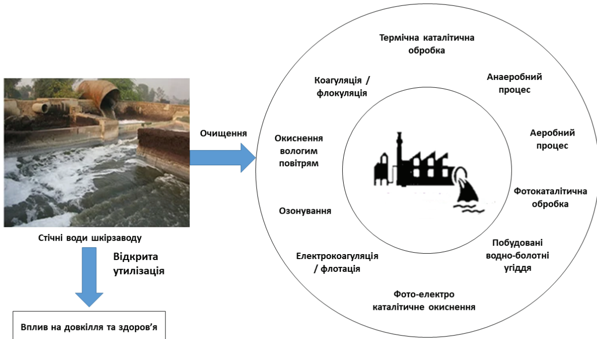
Рис. 1. Стічні води шкіряного заводу: відкрита утилізація та очищення [8]

Для зниження скидання забруднених промислових стоків на очисних спорудах передбачаються установки первинного та вторинного біологічного очищення. Як правило, це знижує органічне навантаження з точки зору біологічного споживання кисню (БСК), але не знижує шкідливе навантаження з точки зору неорганічних солей (загальна кількість твердих розчинених речовин) та кольору стічних вод. Для виключення забруднення підземних, поверхневих вод та водних джерел регулюючими органами прийнято суворі правила щодо впровадження нульового скидання рідини для промислових стічних вод – рекуперації води із стічних вод та повторного її використання. Безпосередньо вилучати воду із стічних вод вторинного очищення складно через невідповідність вимогам до подачі зворотного осмосу. Тому для задоволення цих вимог апробуються різноманітні методи третинної обробки. Так, іншою групою індійських вчених [10] вивчено можливість видалення кольору через залишкові барвники для обробки шкіри за допомогою озону. Також досліджено вплив рН та концентрації барвника на його