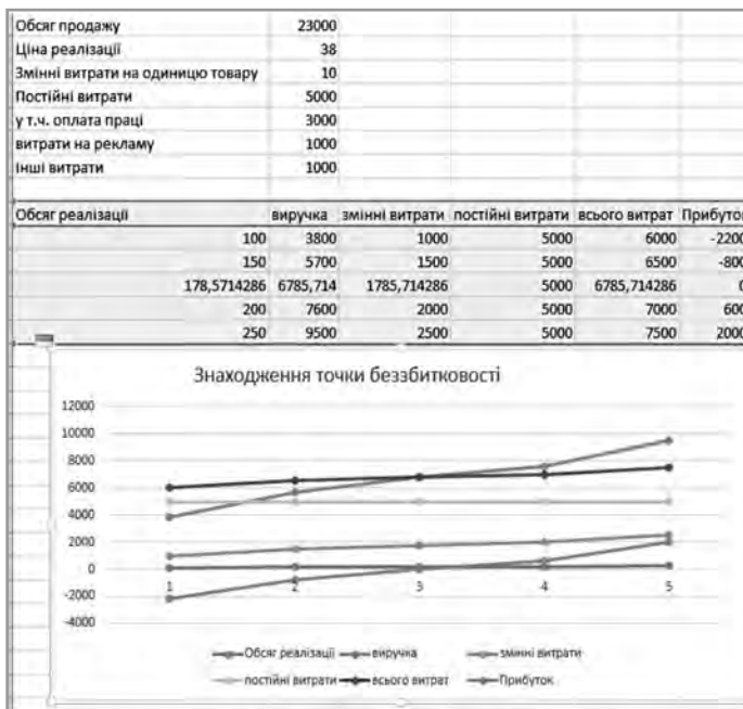
Рис. Знаходження точки беззбитковості засобами EXCEL

Отже, управлінська звітність, по-перше, забезпечує формування прозорості і достовірної фінансової інформації, по-друге, розкриває можливості стратегічного розвитку, економічного потенціалу підприємства, по-третє, дозво-