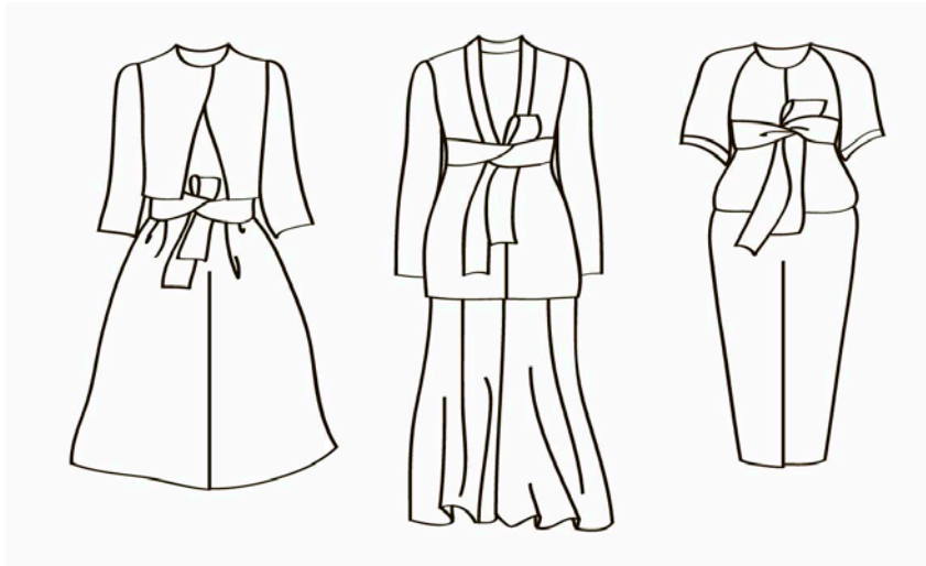
Рис. 2. Зразки моделей одягу Armani Prive Spring 2015 Couture

Висновки. Таким чином, сьогодні роль еkleктики в індустрії моди можна відзначити як вкорінене і потужне джерело натхнення. Вона є невичерпним джерелом для створення нових костюмних рішень і стильових течій. На основі проведених досліджень представлено кілька варіантів прийомів еkleктики в костюмі як приклад для подальшого новоформування в інших варіантах.