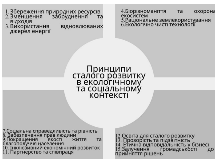
Рис. 2. Принципи сталого розвитку в екологічному та соціальному контекстах

Філософські підходи до інновацій та сталого розвитку в екологічному та соціальному контекстах відображають глибокі переконання та цінності, які формують нашу взаємодію з довкіллям і суспільством (Sakalasooriya, 2021). Вони допомагають визначити, як слід розробляти та впроваджувати нововведення,