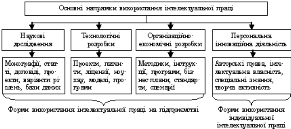
Рис. 1. Форми використання інтелектуальної праці, авторська розробка

Основні форми використання інтелектуальної праці представлені на рис. 1.