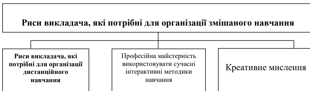
Рисунок 2 – Психолого-педагогічні особливості викладача, які потрібні для організації змішаного навчання (розробка автора)

Вважаємо, що організація змішаного навчання вимагає крім високої мотивації викладача до пізнавальної діяльності, набуття ним нових професійних компетенцій та професійної майстерності використовувати сучасні інформаційно-комунікаційні технології також додатково оволодіння професійними якостями й наявності в нього особистих важливих рис характеру (рис. 2). Так, креативність у XXI столітті є головною якістю викладача. Креативність (англ. create – створювати, creative – творчий) – це здатність створювати нове з того що вже є, це гнучкість та оригінальність, вміння додати до існуючого курсу цікаві деталі, зробити його різноманітним.