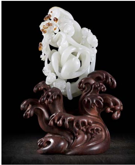
Рис. 1. Дешенг Ву "Дівчина-змія", робота із серії "Оголена жінка". Фото: студія різьблення по нефриту Дешенг Ву, 2007, Китай

Яна, як стародавні китайські нефритові природою та прийняття гармонії між вироби, служать каналом для зв'язку з людиною та навколишнім середовищем.