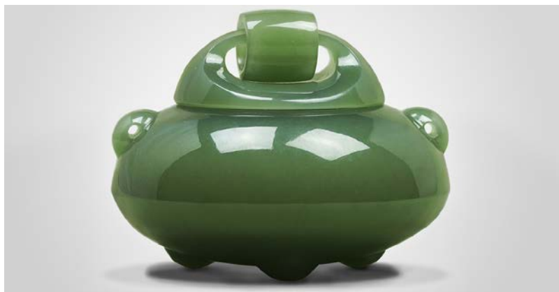
Рис. 3. Гуан Ян "Кадильниця". Фото: Британський музей, 2017, Китай