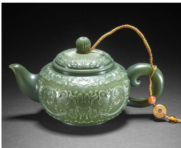
Рис. 5. Тін Ю, чайник. 2011, Китай