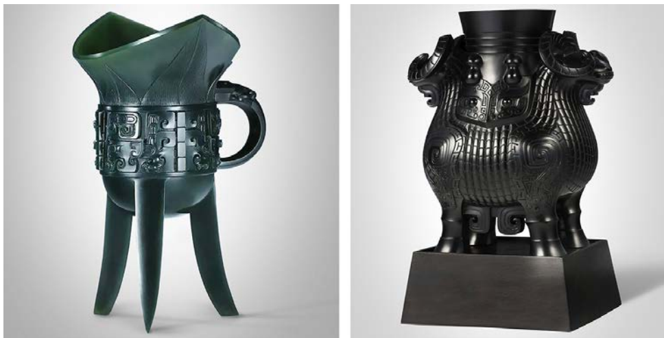
Рис. 2. Хонгвей Ма "Кубок для вина (Цзюе)" (ліворуч) та "Бронзовий баран Цзун" (праворуч).