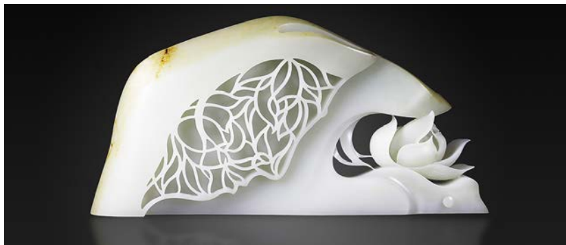
Рис. 4. Сі Ян, Білий Лотос. Фото: Британський музей, 2016, Китай

Мистецький підхід митця Івей Чжай прагне відродити давнє нефритове ремесло, використовуючи традиційні техніки, що передаються з покоління в покоління. Підкреслюючи простоту та мінімалізм, зосереджуючись на природній красі нефриту, його вироби демонструють витончені техніки різьблення та полірування. Роботи Чжая були представлені на престижних виставках, зокрема на Пекінській міжнародній художній бієнале та в Музеї образотворчих мистецтв Тайбея. Відданість Чжая збереженню традиційного нефритового ремесла слугує нагадуванням про глибоко вкорінене культурне значення нефриту в історії Китаю.