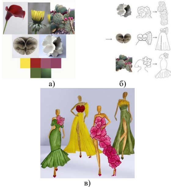
Рис. 3. Стадії розробки колекції моделей вечірніх суконь:

а) джерело натхнення; б) трансформація в ескізи; в) моделі вечірніх суконь