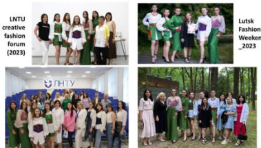
Рис. 4. Колекція жіночого одягу «Українська хустка – моя броня» на модних показах

Виготовлена колекція була представлена на модному показі Lutsk Fashion Weekend 2023 та фешн-заході ЛНТУ «LNTU creative fashion forum» (рис. 4).