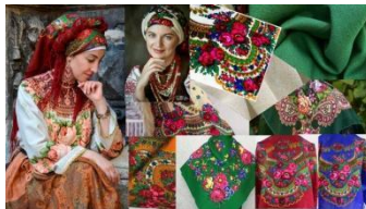
Рис. 1. Mood board колекції жіночого одягу «Українська хустка – моя броня»

Творчим джерелом в даному процесі стали орнаменти української хустки, окремі елементи яких використано для оздоблення виробів колекції. Для візуалізації джерела натхнення було застосовано техніку створення mood board (рис. 1).