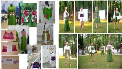
Рис. 3. Процес виготовлення та готові моделі колекції жіночого одягу «Українська хустка – моя броня»

ергономічні і естетичні. Процес виготовлення та готові моделі колекції подано на рис. 3.