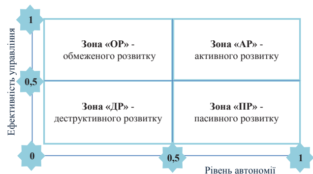
Рис. 3. Матриця стратегічного вибору на основі оцінки ефективності управління та рівня автономії ВНЗ

Таким чином, ураховуючи ефективність управління та рівень реальної автономії ВНЗ, розроблено матрицю стратегічного вибору ВНЗ (див. рис. 3), яка дає змогу об'єктивно обґрунтувати напрями стратегічного розвитку навчального закладу та вибір оптимальної стратегії в сучасних умовах функціонування системи освіти й, зважаючи на результативність діяльності і можливості ВНЗ, надані зовнішнім середовищем.