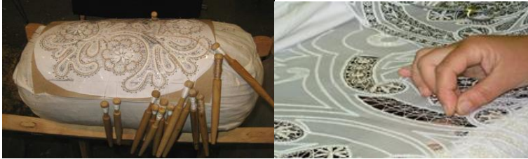
Рис. 1-2. Коклюшкове плетіння; шите мереживо

Бобінське плетіння виготовляється за допомогою спеціальних паличок з дерева, на які намотують нитки. Характерною особливістю цього способу створення ажурних візерунків є складність і трудомісткість роботи (рис.1).