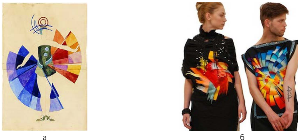
Рис. 3. Колекція Руслана Панчука за мотивами творів О. Екстер: а – ескіз костюма О. Екстер, 1924 р. [22]; б – моделі колекції, 2006 р. [13]