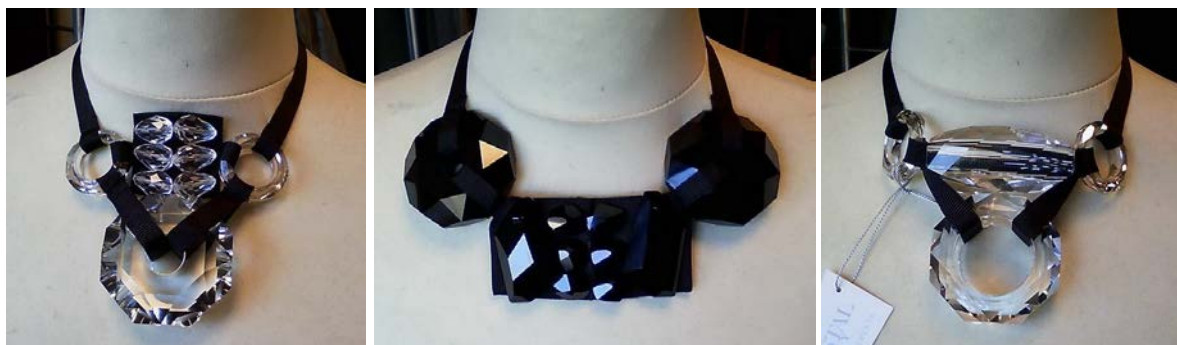
Рис. 5. Колекція прикрас Л. Пустовіт із кристалами Swarovski за мотивами творчості О. Екстер, 2008 р.