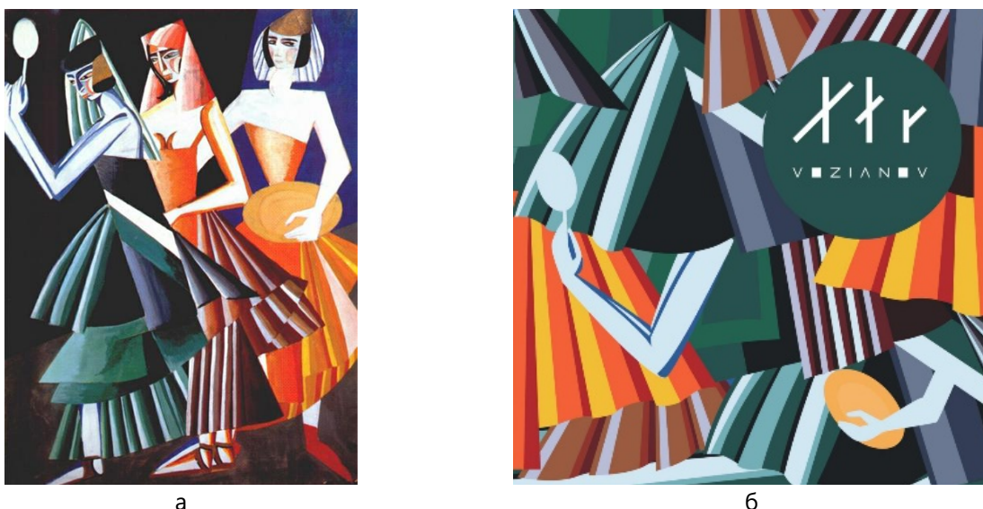
Рис. 6. Сукня-картина Ф. Возіанова за мотивами ескізу О. Екстер: а – ескіз костюмів для епізоду спектаклю «Танок семи покривал» О. Екстер, 1917 р. [22]; б – проєкт Ф. Возіанова для «EXTER.live», 2021 р. [16]