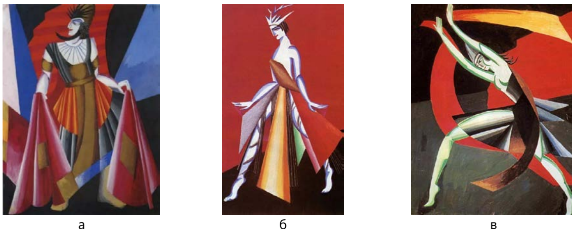
Рис. 1. Ескізи костюмів О. Екстер для персонажів вистави О. Уальда «Саломея», 1917 р.: а – Ірод, б – Саломея, в – Танок семи покривал [22]

думкою, повинні бути побудовані на простих геометричних формах та основних чистих кольорах.