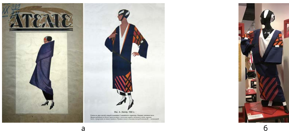
Рис. 2. Ескізи костюмів О. Екстер та приклад втілення в матеріалі: а – обкладинка та сторінка журналу «Ательє» № 1 з моделями О. Екстер «галицького характеру», 1923 р. [22]; б – реконструкція костюма за ескізом О. Екстер, автор Ю. Ситникова, 2017 р.