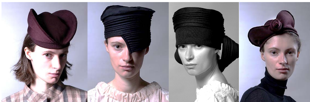
Рис. 8. Головні убори бренду Zahara за мотивами творчості О. Екстер, 2021 р. [17].