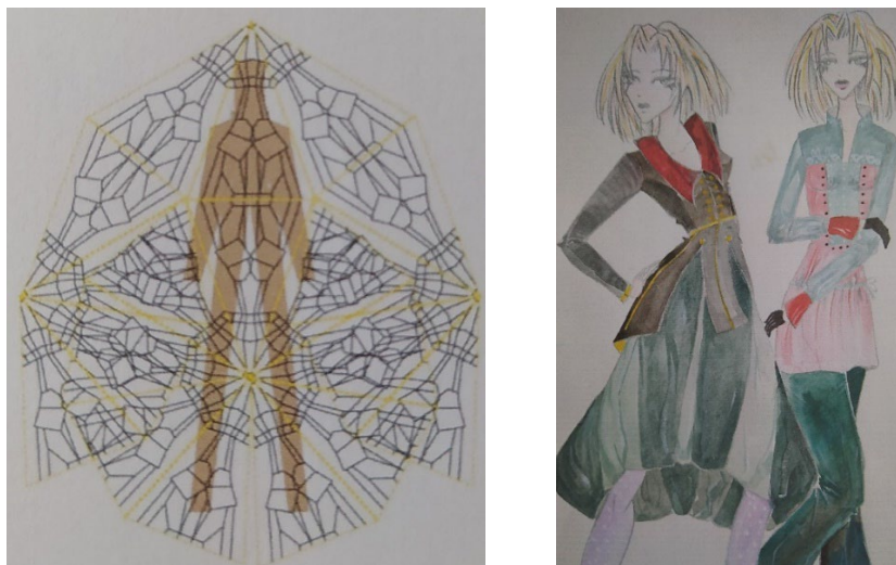
Рис. 3. Базові членування та ескізи колекції жіночого костюма на основі адаптації калейдоскопічних відображень форми символу костюма Америки

Аналіз причин виникнення певних форм, математичне перетворення їх та адаптація до сучасної модної ситуації дали змогу створити концепцію колекції жіночого одягу (рис. 2). У колекції поєднані принципи організації орнаменту народного вбрання, форми і лінії сформовані калейдоскопічними відображеннями, асортимент відповідає сучасності і заявленій сезонності колекції.