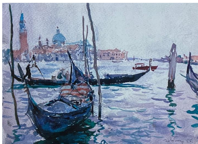
Рис. 5. Венеція. На лагуні. Тетяна Яблонська, 1956, папір, акварель. Національний художній музей України