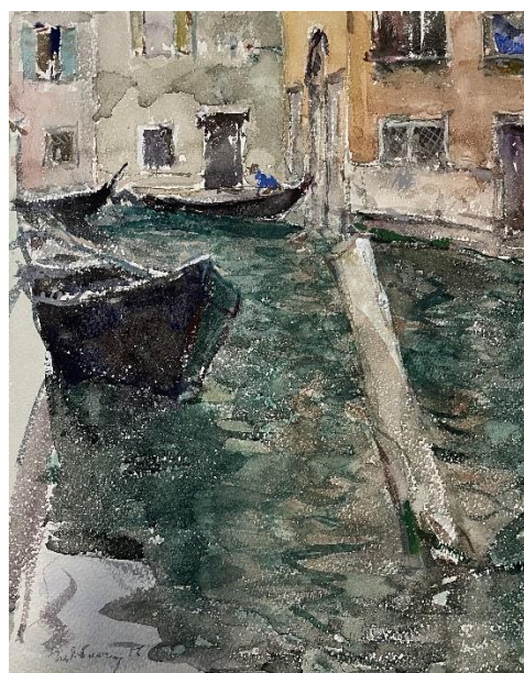
Рис. 4. Венеція. Гондоли. Тетяна Яблонська, 1956, папір, акварель. Національний художній музей України