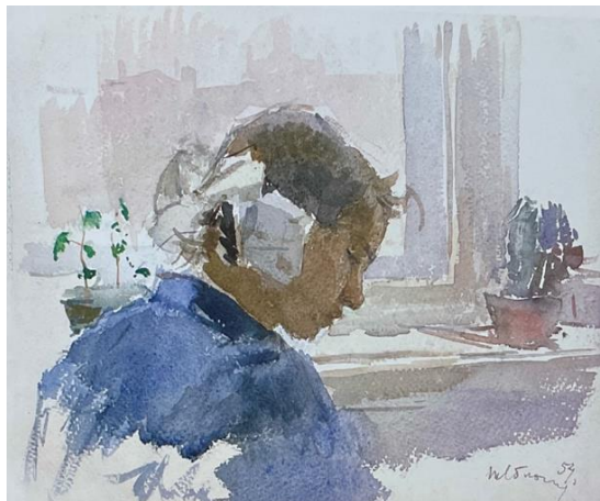
Рис. 1. Леля біля вікна. Тетяна Яблонська, 1954, папір, акварель. Власність автора