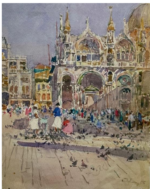
Рис. 3. Венеція. Площа Святого Марка. Тетяна Яблонська, 1956, папір, акварель. Національний художній музей України