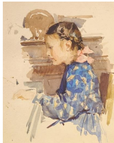
Рис. 2. Дівчинка за фортепіано. Тетяна Яблонська, 1954–1955 рр. папір, акварель. Власність автора