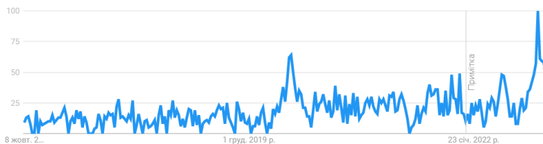
Рис. 1. Кількість запитів «купити спортивний костюм» на платформі Google за останні 5 років

Провівши аналіз кількості запитів «купити» спортивний костюм за допомогою платформи Google Trends встановлено, що популярність спортивних костюмів нещодавно зростає (рис. 1). Так, у період з 8 вересня по 12 вересня 2022 р. зафіксовано максимальне число звернень за останні 5 років. Тому проектування одягу у спортивному стилі, зокрема спортивних костюмів є актуальним напрямком сьогодення.