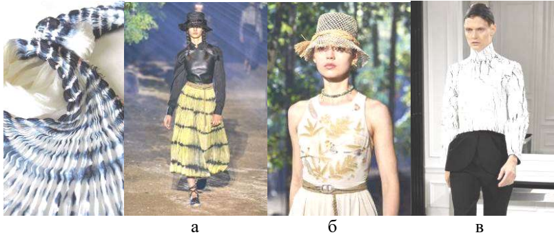
Рис. 3. Вироби із застосуванням старовинних технік: а – Shibori, Christian Dior SS2020, Париж [5]; б – еко-друк, Christian Dior, SS2020, Париж [6]; в – техніка кракелюру, Balenciaga AW2013, Нью-Йорк.

Таким чином, проаналізовано старовинні методи обробки тканин та спектр їх застосування дизайнерами фешн-індустрії. Визначено, що відомі Будинки мод надихаються цими мотивами для створення колекцій і допомагають транспонувати колективний досвід в новий стиль життя.