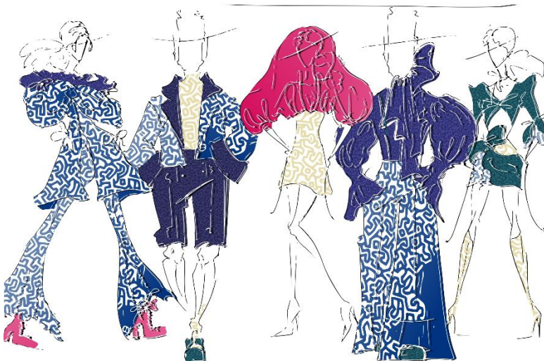
Рис. 3. Ескізна проробка стильової творчої колекції