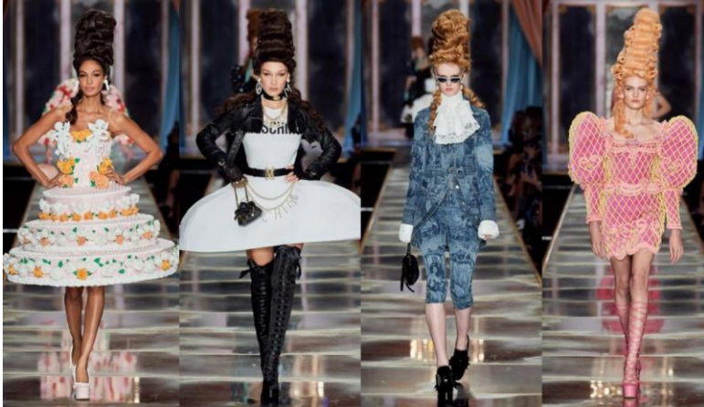
Рис. 2. Колекція дизайнера Джеремі Скотта для будинка моди Moschino, осінь-зима 2020/2021

на робила Марія Антуанетта та поплатилася за це своїм життям. Саме комбінація стилю королеви, як знехтувала цінності народу та вічна пам'ять вірних фанатів художника Кіта Гарінта (рис. 3).