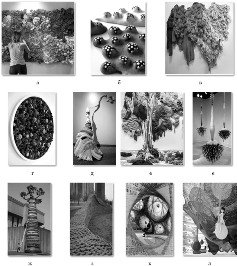
Рис. 1. Приклади фактурних рішень текстильної скульптури: а — композиція з об'ємних елементів, автор: Кейт Лейбранд; б — валяння, автор: Атсуко Сааки; в — закладання різноманітних форм складок на тканині, автор: Ханне Фрііс; г — скручування стрічок зі шкіри, автор: Роуен Мерш; д — композиція з об'ємних елементів, автор: Сомер Роман; е — плетіння та валяння, автор: Ванесса Баррагао; ж — обкручування шнуром, автор: Джоел С. Аллен; з — автор Майк Де Батс; к — павільйон у Штутгарті, колективна робота; л — автор Тошико Хоріучи Макадам

об'єкти з високими художньо-естетичними характеристиками.