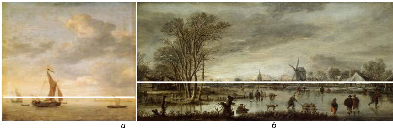
Рис. 1. Приклади пейзажного живопису характерні періоду Ренесансу зі схематичним позначенням лінії горизонту: а – Ян Порцелліс. Однощогловий корабель і шлюпка (1630 р.); б – Арт ван дер Нер. Зима на річці (1645 р.).

У живопису періоду Бароко більш ускладненим стає сприйняття природи через осягнення її мінливості (рис. 2). Художники намагалися передати динаміку навколишнього світу, бурхливе життя стихій. Діапазон художнього відображення ставав більш широким – від грандіозних, космічних за охопленням образів до ретельно відтворених пейзажів рідної природи. З'явилися нові жанри пейзажу, такі як міський, фантастичний, епічний і національний [5].