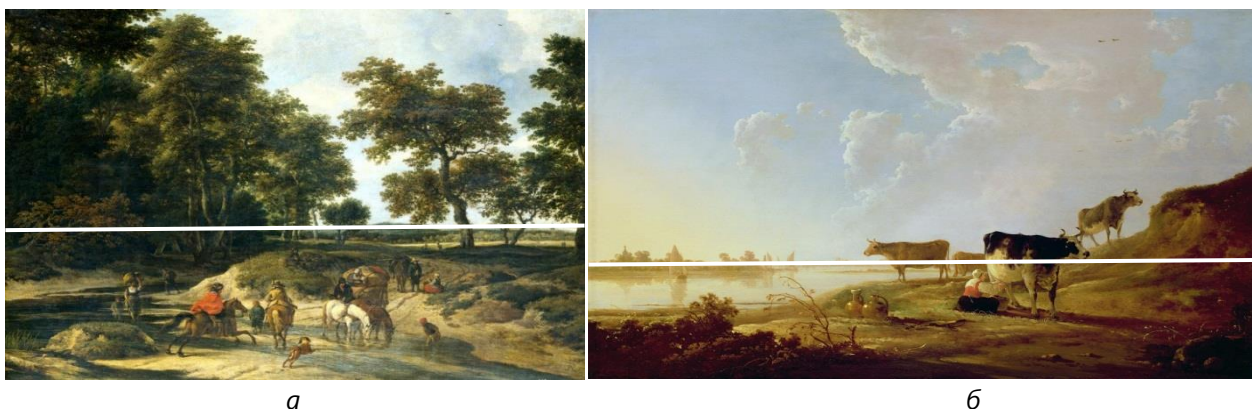
Рис. 2. Приклади пейзажного живопису характерні періоду Бароко зі схематичним позначенням лінії горизонту: а – Якоб Ван Рейсдал. В лісі (1682 р.); б – Альберт Якобс Кейн. Корови на березі річки (1659 р.)