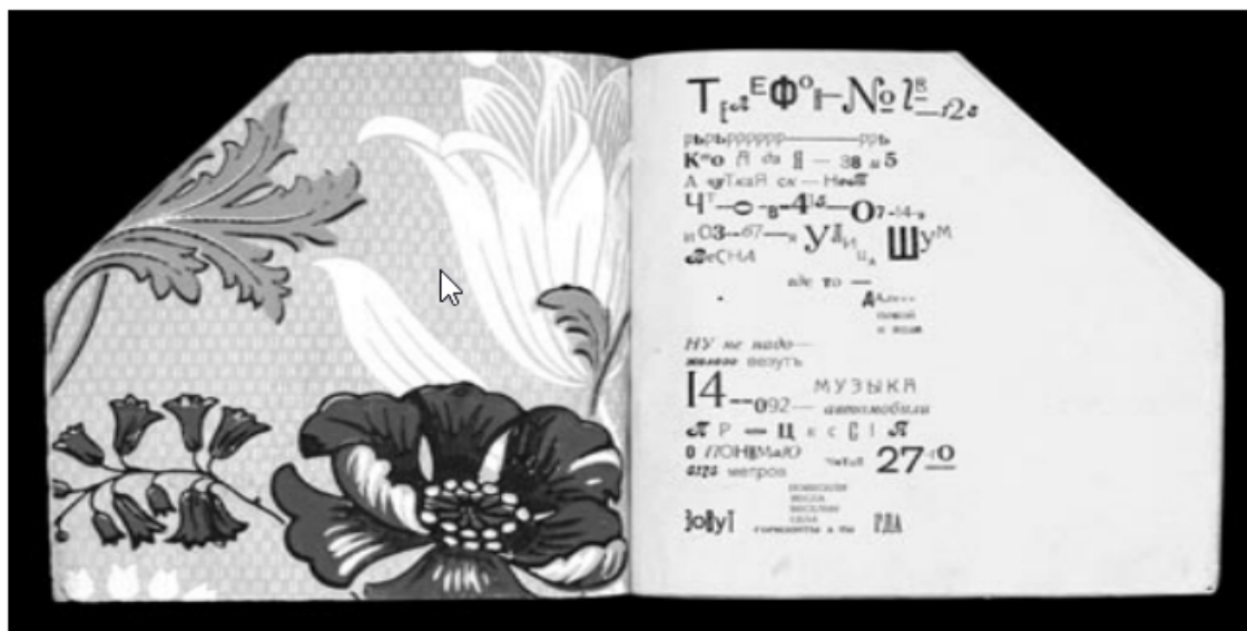
Рис. 2. Збірка Василя Каменського «Танго з коровами: Залізобетонні поеми» (1914).

великих, пластикових і плоских елементів, направляючих, перетворюючи пробіли у частину композиції.