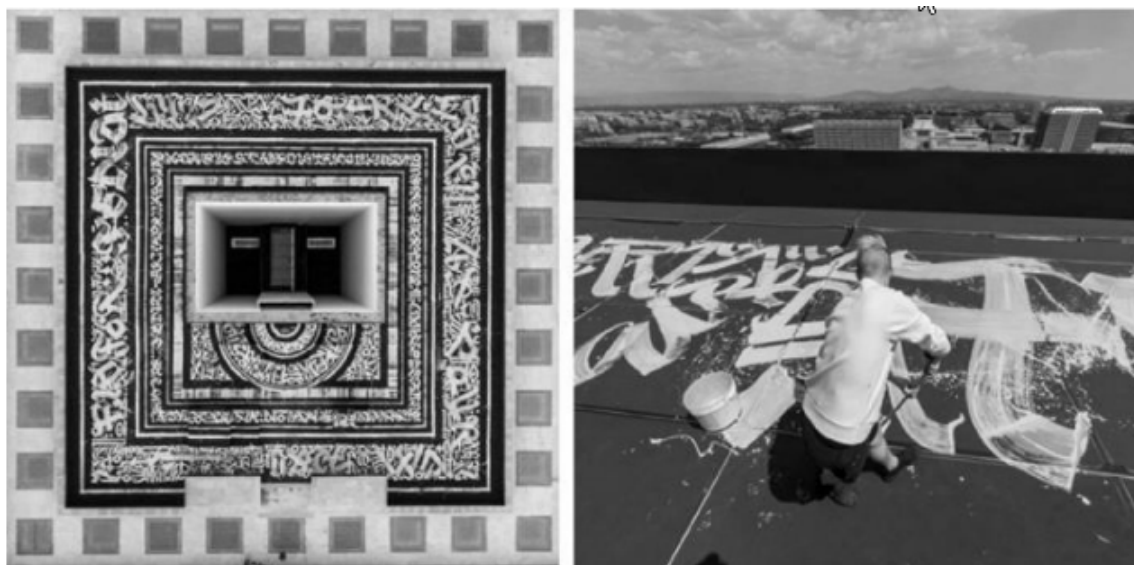
Рис. 3. Розпис на даху «Квадратного колізею» штаб-квартири модного будинку «Fendi», Італія, 2016 р.

Актуальність каліграфофутуризму кожен день підтверджують численні пропозиції світових брендів про колаборації та співпрацю з великими організаціями (Lamborghini, Levi's, Adidas, Nike, Fendi, Яндекс тощо); значний розвиток перфоменсу виражений в синтезі з іншими творчими галузями для створення сильного візуального ефекту, що створює ажіотаж навколо кожної нової роботи художника; створення першого NFT токена з каліграфофутуризмом (рис. 3).