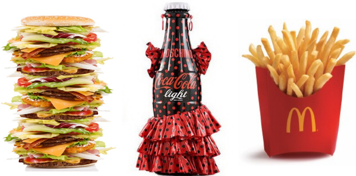
Рис. 2. Продукція быстрого питания и ее упаковка

Так же органічно в этот необычний костюмний дизайн включені іронія и клоунада . Іронічне цитування дозволяє маніпулювати любыми готовими формами и акцентувати увагу на аномальних состояниях в сучасному світі. А клоунада як вневременной феномен масової культури созвучна уличной моді с ее готовностью комбінувати неординарні вещи «цвета счастья», винтажні и самодельні изделия [3, 4].