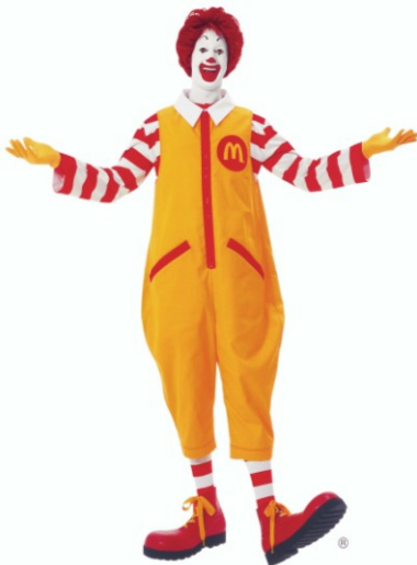
Рис. 3. Клоун Рональд Макдональд, талисман компании McDonald's .

Так же органічно в этот необычний костюмний дизайн включені іронія и клоунада . Іронічне цитування дозволяє маніпулювати любыми готовими формами и акцентувати увагу на аномальних состояниях в сучасному світі. А клоунада як вневременной феномен масової культури созвучна уличной моді с ее готовностью комбінувати неординарні вещи «цвета счастья», винтажні и самодельні изделия [3, 4].