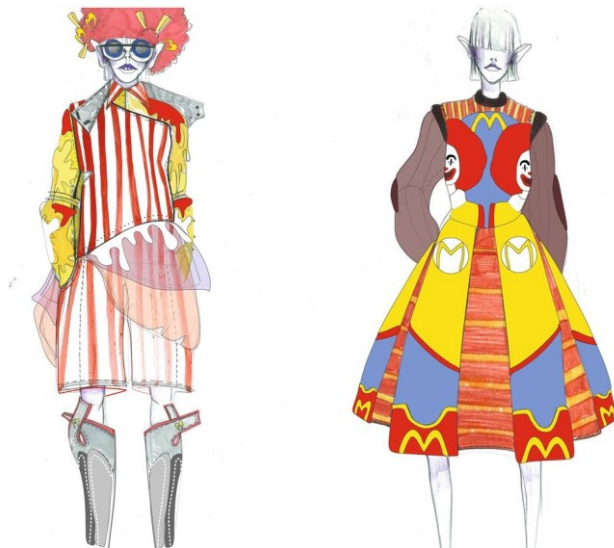
Рис. 4. Эскизы моделей, обыгрывающие образ Рональда Макдональда. Я. Доброжинская, 2015