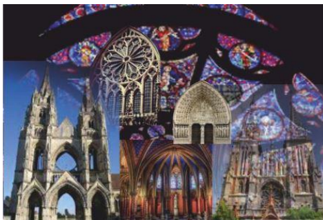
Рис. 1. Колаж творчого джерела – готичний стиль в архітектурі

На рисунку 1 наведений колаж творчого джерела – готичний стиль в архітектурі. Трансформація джерела натхнення відбувається з огляду на його виокремлені, переосмислені та розвинуті характеристики, після чого обирається спосіб їх перенесення на об'єкт дизайн-проекування [2], як показано на рисунку 2.