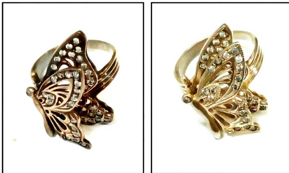
Рис. 1. Вигляд ювелірного виробу до чищення (зліва) і після чищення (справа)

Час очищення виробів залежить від ступеню забруднення поверхні, але, як правило, не перевищує 5 хвилин. Результати процесу показано на рис. 1.