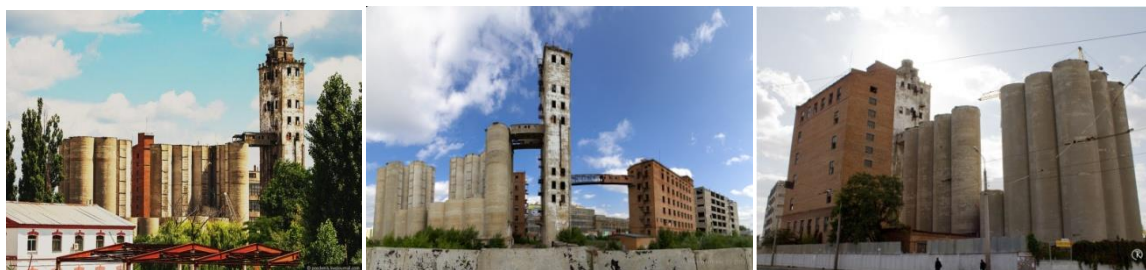
Рис.1. Елеватор в м. Харків, наш час

«Республіка Елеватор» – не фігура мови. На думку учасників акції, на території покинутого елеватора (Рис. 1) можна було б створити аналог «Республіки Ужупіс» у Вільнюсі. У 1997-му році «творча богема» міста проголосила район Ужупіс «республікою». Незабаром там з'явилася своя Конституція, гімн, прапор, валюта та інші атрибути державності (зрозуміло, офіційно все це не має юридичної сили і ніяк не загрожує територіальній цілісності Литви).