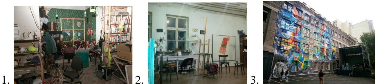
Рис. 2. Сучасні сквоти м.Києва: 1. - «Хаятт»; 2. - «Садок»; 3. - «Arksquat» (під час «Гогольфесту»)

У 1990 р. на вул. Олегівській утворився сквот з групи художників «Холодний ВЕЛ», що пізніше був перейменований в «FGE» (Fiction Gallery Expedition). У 1994 р. виник сквот «БЖ-АРТ» (від назви вулиці Велика Житомирська, чільне місце там обіймав відомий український художник Матвій Вайсберг). Будинок спеціально переобладнали під майстерні і галерею, влаштовували вечірки і концерти.