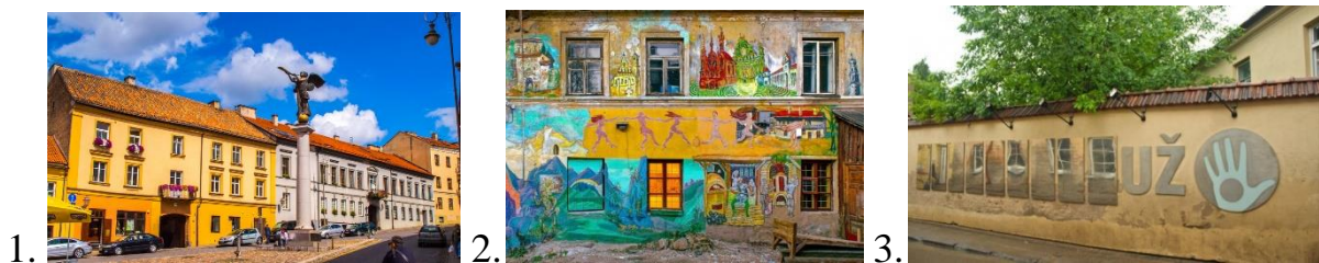
Рис. 4. 1. Ангел на центральній площі Ужупіса - символ республіки; 2. Стіна «Užupis» Art Incubator gallery; 3. Стіна, на якій можна прочитати Конституцію Ужупіса на 18 мовах світу

Паралельно сквотинг розвивався в Прибалтиці. Згаданий вище «Ужупіс» на початку 1990-х був депресивним і занедбаним районом, в якому розміщувалася трикотажна фабрика "Вілія" і завод електролічильників. Біля річки Вільняле був організований сквот, який в подальшому перетворився в інкубатор мистецтв "Будинок над річкою» (Рис. 4).