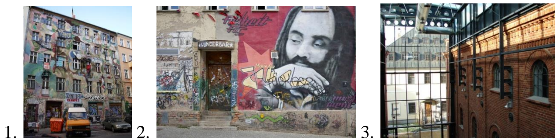
Рис. 5. 1. Сквот у Фрідріхсхайні, м. Берлін; 2. В Англії сквотери заселяють цілі квартали, наприклад східні Лондон Філдз; 3. Арт-інкубатор «Фабрика мистецтва» (Fabrika Sztuki), м. Лодзь

У період з 2009 по 2011 роки вартість експорту послуг з творчих індустрій збільшилася на 16,1% – в порівнянні зі збільшенням на 11,5% загального обсягу експорту послуг Великобританії.