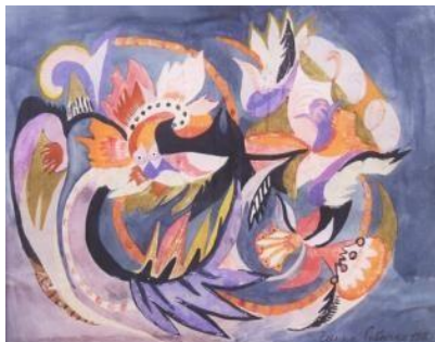
Рис. 3. Тривога. 1916 р. Ганна Собачко [5]

Серед сучасних художників навряд чи можна знайти представників по-справжньому наївного мистецтва, враховуючи поширення самонавчання як форми оволодіння професійними знаннями.