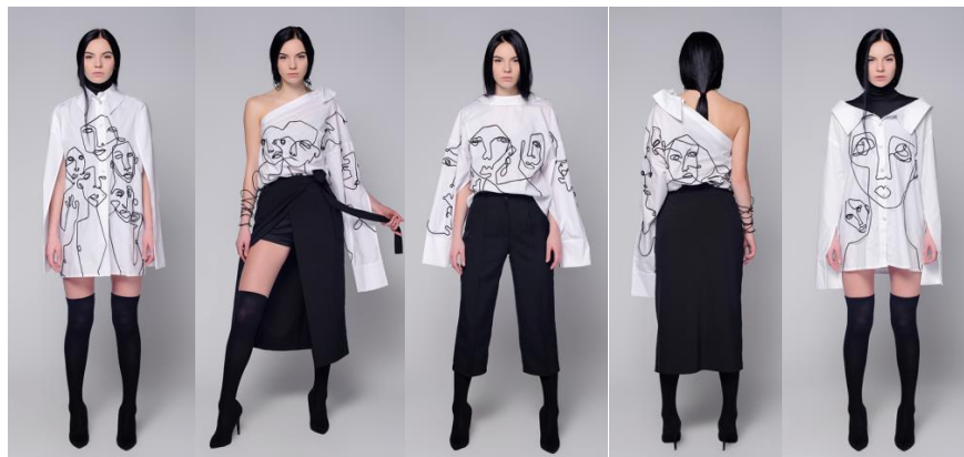
Рис. 4. Колекція жіночого одягу «Твоє обличчя» (автор – студ. Тайпс Т. І., керівник доц. Троян О. М.)