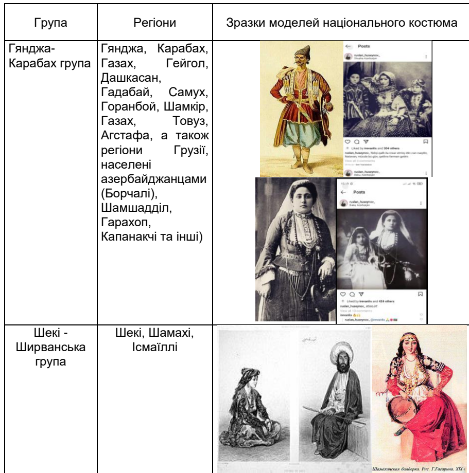
Таблиця азербайджанського національного одягу по регіонам

родини Мірзи Гадіма Ірвані, палацу хана Ірвані [5]. Детальна інформація про азербайджанський чоловічий та жіночий одяг також згадується в епосі Кітабі-Дада Горгуд. У сазі (національній музичний інструмент) одяг зазвичай називають «доном».