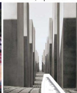
Рис.2б, Фрагмент МК