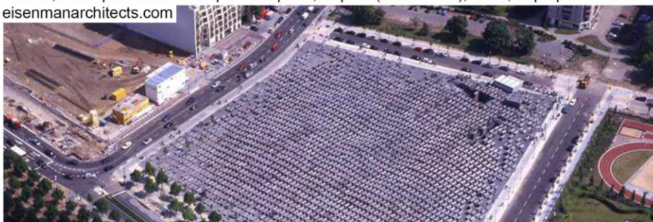
Рис.2а, Меморіал Убитим Євреям Європи, Берлін (Німеччина), 2005, аерофотозйомка