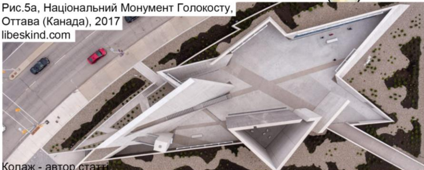
Рис.5а, Національний Монумент Голокосту, Оттава (Канада), 2017 libeskind.com