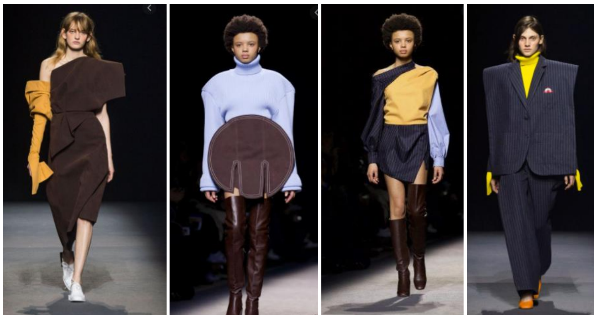
Рис. 6. Моделі із колекцій Сімона Порта Жакмю

деконструкції і точністю своїх ліній колекція Жакмю привернула увагу аваегардної дизайнерки, засновниці Comme Des Garcons. У Сімона Жакмю є свій почерк: асиметричний крій, одяг-трансформер, стримана палітра, об'єми, що змінюють силует [13] (рис. 6). При цьому колекції дизайнера більше тяжіють до мінімалізму, хоч і не позбавлені складних конструкторських, а точніше деконструкторських рішень.