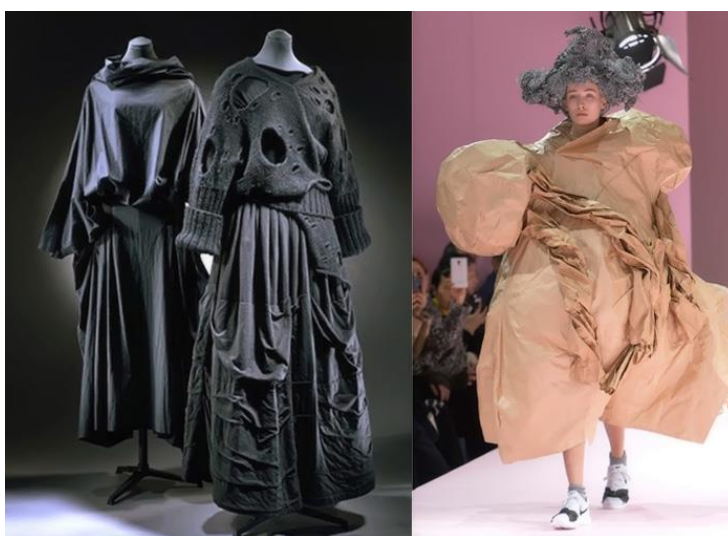
Рис. 4. Моделі дизайнерки Рей Кавакубо 1981 рік

Стиль «деконструктивізм» в контексті нової естетики привніс в дизайн одягу нові декоративні ознаки: діри, розриви, потертості, зумисну недосконалість. Створене людиною не завжди досконале, але тим не менш, може бути прекрасним. В абсолютній симетрії і правильності немає руху, немає життя – вона штучна. Руйнування структури матеріалу дає формі нове прочитання, викликає нові відчуття та емоції [9, 371].