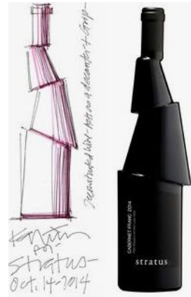
Рис. 2. Пляшки для вина. Карім Рашид

Стиль «деконструктивізм» в дизайні одягу як концепція сформувався на початку 1980-х років, але руйнування загальноприйнятих канонів у моді ствердили Коко Шанель, Жан Поль Готьє, Вів'єн Вествуд.