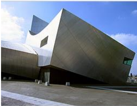
Рис. 1. Північний філіал Імперського військового музею в Манчестері. Даніель Лібескінд

Результати досліджень. Поняття «деконструкція» несе в собі дію, яка застосовується до традиційної архітектури чи структури та передбачає розкладання, розшарування цієї структури на частини, щоб зрозуміти, як певний ансамбль був сконструйований та реконструювати його [2, с. 54]. Деконструкція в архітектурі - це простір, який відкривається, стан простору, відкритий для перетворень. Похилі стіни та підлоги, косі стійки та вікна – ці будівлі, які, здається, зазнали землетрусів, насправді є результатом продуманої роботи архітекторів. Цей вибух форм відображає свободу архітекторів та дизайнерів, здатних породити такі потужні твори, водночас, як пластичні, так і інтелектуальні [3, 4] (рис. 1, 2).