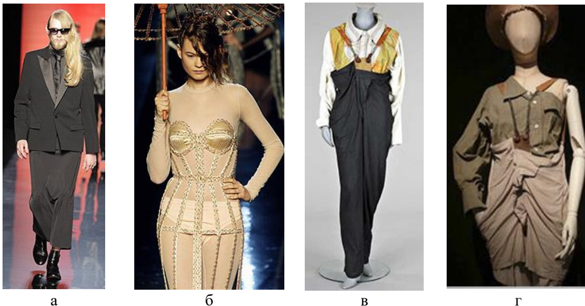
Рис. 3. Моделі з колекцій 70-80 років: а, б - Жан Поль Готьє; в, г - Вів'єн Вествуд

та сукні, елементи яких перетворювали силуети в новий витвір мистецтва, знайшли своїх поціновувачів і мали колосальний вплив на моду 80-х. Колекція японських дизайнерів на Тижні моди у Парижі (1981 рік) зруйнувала стереотипи європейської моди, за що і отримала назву «destructuree look».